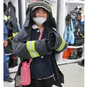
縦割り班活動、6年生が一生懸命下級生に教えます