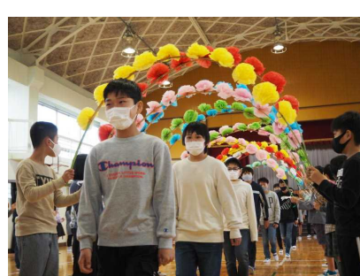
花のアーチと拍手で送ります