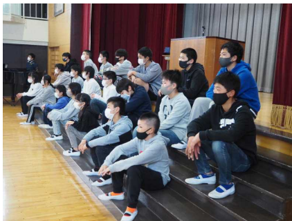
在校生の言葉と歌をじっくり聞きます