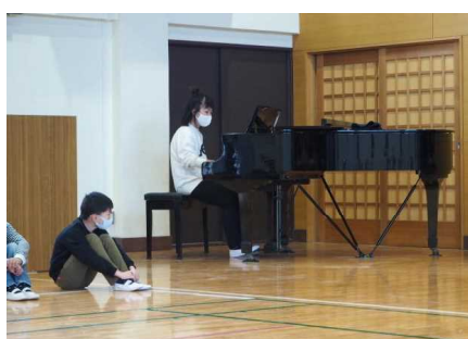
ぼくらの気持ちを歌ったいい曲です