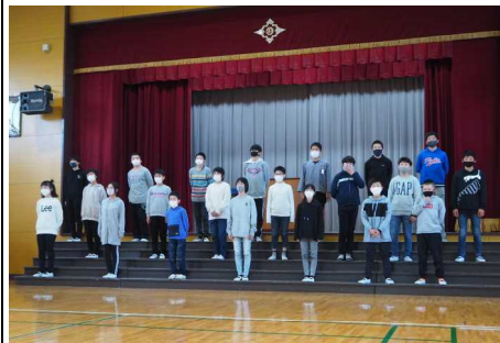
6年生からのメッセージと最後の歌声