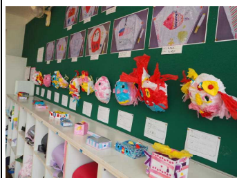
へんしんお面とたからばこ (2年)

お互いに各教室を回って鑑賞しましたが、どの学年も1人1人の個性が光り、素敵な力作ばかりでした。