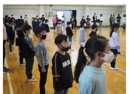
お祝いと感謝の心があふれます