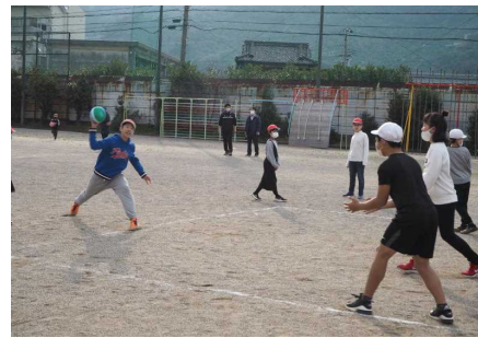
6年生同士は力を抜きません