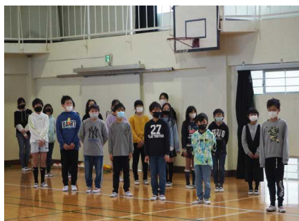
在校生も練習の何倍もの声が出ました