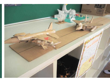
段ボールでできた戦闘機 (さつき2)