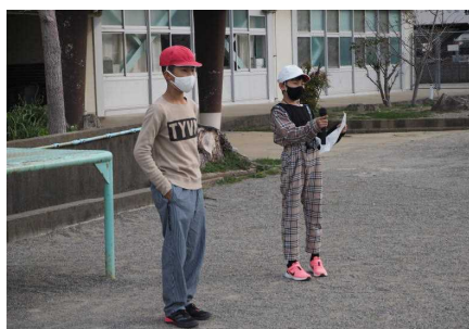
進行は新児童会役員