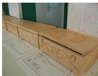
木工細工のオルゴール (6年)