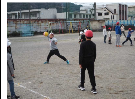
今までにない盛り上がりです