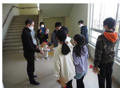
担任にも感謝を伝えます