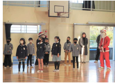
サンタが来た楽しいクリスマス集会