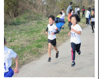
12/12 オレンジマラソン 26名参加