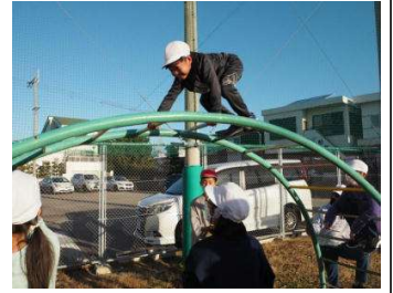
挑戦！上級生が見守ります

きれいな物を見てきれいだと思えることや、思いを素直に相手に伝えることができる、これも心の成長ですね。