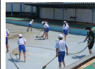
5・6年生によるプール清掃