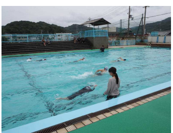
教員のジェスチャーで授業が進みます