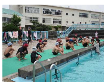
マスクを外すので喋りません