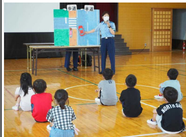
交通安全教室（1年生は道路の渡り方、3・4年生は自転車の乗り方など）