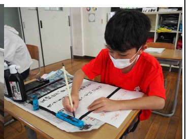
こま筆は難しい（6年）