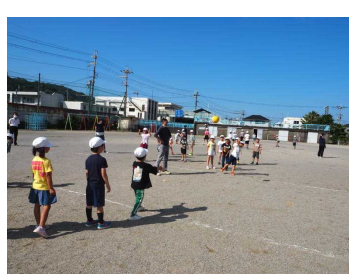
ドッジボールラリー、何回投げると