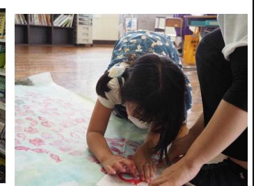
国語「スイミー」の絵作成（2年）