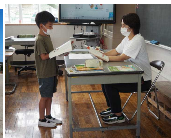
本読みのテスト（3年）