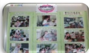
掲示物で啓発活動