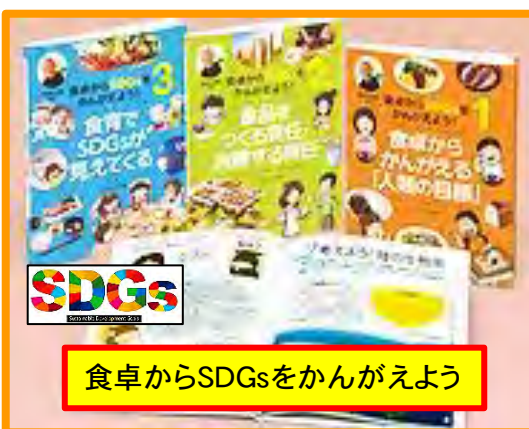
食卓からSDGsをかんがえよう