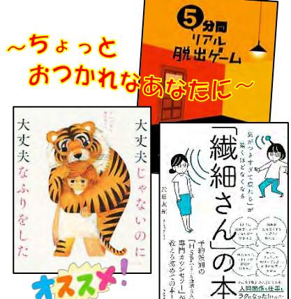
～ちょっとおつかれなあなたに～