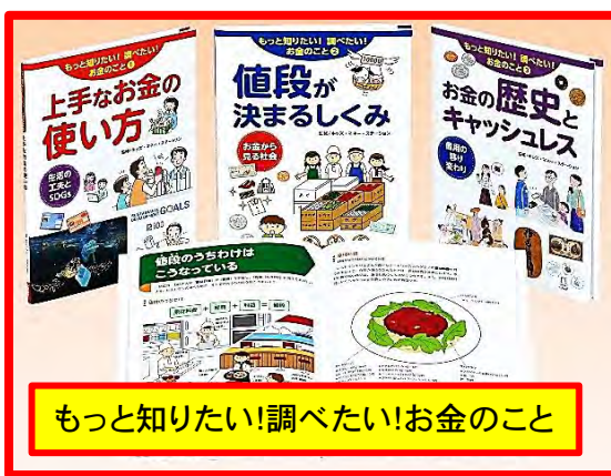
もっと知りたい! 調べたいお金のこと