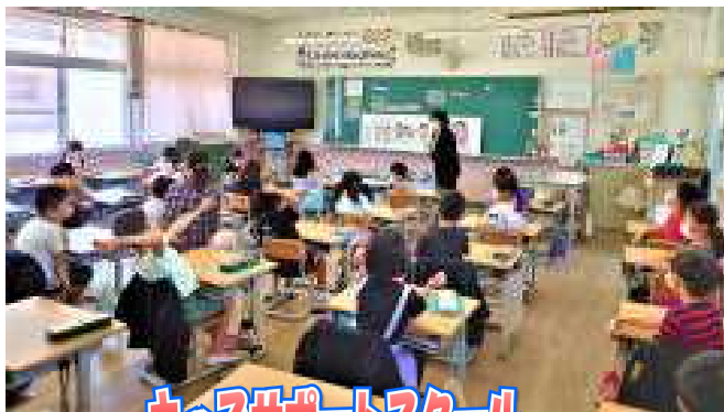
キッズサポートスクール