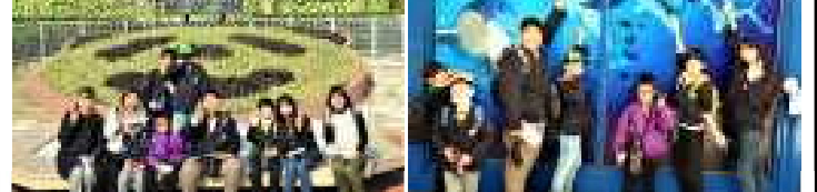
アドベンチャーワールドでお勉強 たちばな学級 合同社会見学