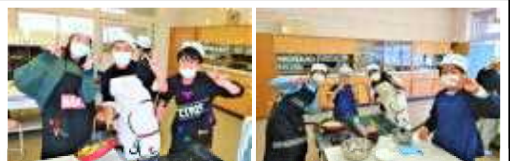
DELICIOUS ベーコンポテト 6年家庭科