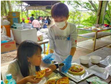
おいしくな～れ ピザ作り