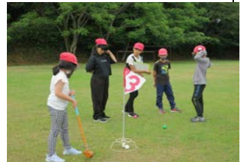
声を掛け合ってグランドゴルフ