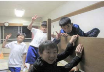
みんなとの宿泊は初めて