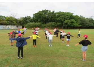
朝のつどいでラジオ体操