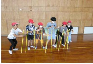
「チャレンジ・ザ・ゲーム」どれも息を合わせるのがポイント。チームワークが大切です。