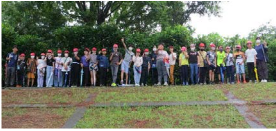
広村堤防で。稲村の火の館も見学しました