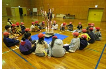
盛り上がるキャンドルファイヤー