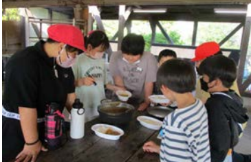
カレー、おいしくできたかな？