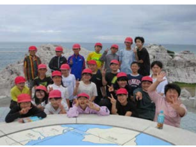
白崎海洋公園で記念写真