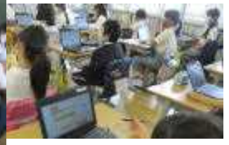
GIGAスクール構想のもと「1人1台端末」 どの教科で、どのように効果的に活用するか、 検証しながら進めていきます!