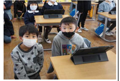
3年が1・2年にタブレット操作を教えました