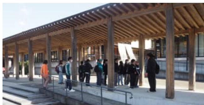
世界遺産センター到着

和歌山県世界遺産センターでは歴史上・学術上極めて高い価値を有する世界遺産「紀伊山地の霊場と参詣道」について、資産を確実に保存しながら次世代に継承していくために、分かりやすく世界遺産について学習できるプログラム「世界遺産入門」(60分間プログラム)と、現地での参詣道ウォークや清掃活動を実施してくれています。事前学習については学校ですで行いました。