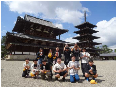
法隆寺・東大寺 記念写真を撮りました。

修学旅行では、見たこと、聞いたことを、しっかりメモし、しっかり学ぶ姿が見られました。また、集団行動するうえでのルールやマナー等を身につけるよい機会にもなりました。この経験を今後の学習・生活に生かしてほしいと思います。