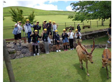
奈良公園 しかと、記念写真を撮りました。