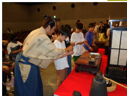
お侍さんに、江戸時代のことを教えてもらいました。