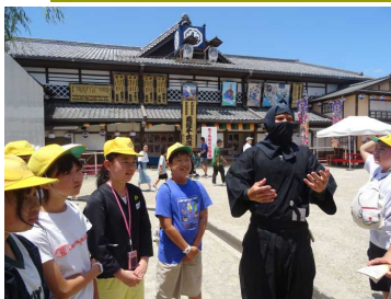
映画村には、忍者がいました。