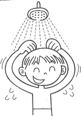
シャワーをあびる