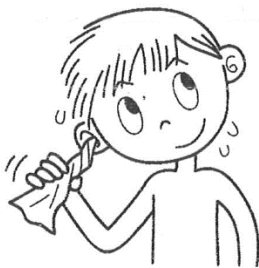
みみ みず はい 耳に水が入ったら みず 水ぬきをする