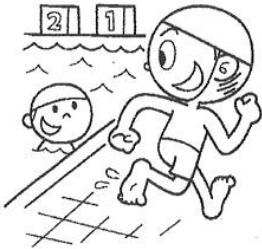
プールサイドを走らない