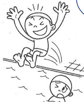
かつてに飛びこんだり、ふざけて人をおさない