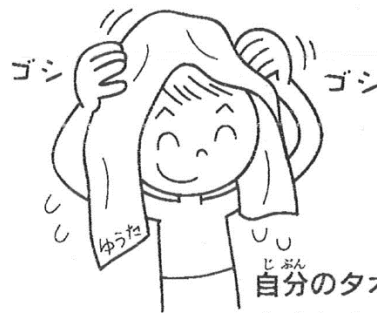
自分のタオルでよくふく (タオルやブラシのかしかりはしない)