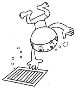
排水口や循環口にはさわらない