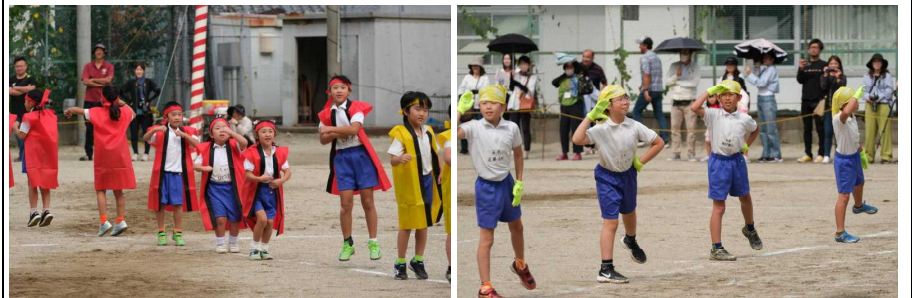
低学年ダンス 法被が似合っています 中学年ダンス カラーの軍手が映えました