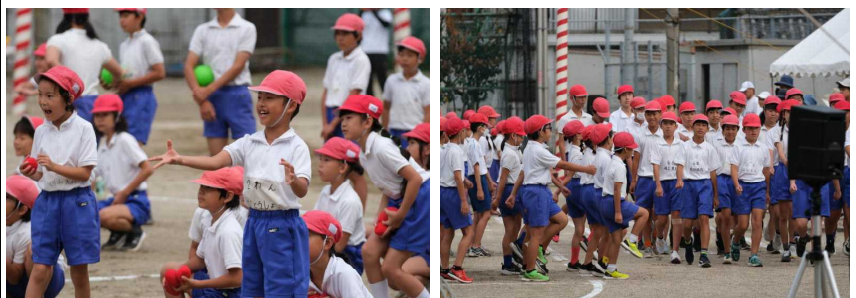
結構楽しめた バケツキャッチ 行進の足並みも揃っていました

田鶴は走る競技が多くあります。全力で走るから勝ち負けにもこだわります。でも、終わった後はみんな笑顔になれました。