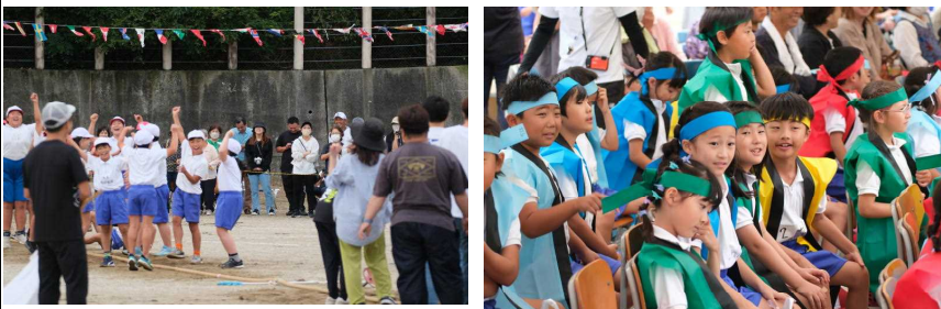
親子競技で綱引き「バンザーイ！」 ダンス前 ちょっと緊張