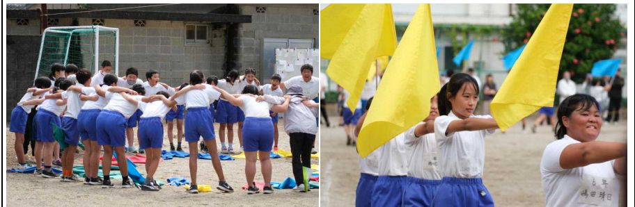
高学年表現運動 気合いを入れて 旗振りがきれいに揃いました

ご観覧、応援、また準備や片付けをしていただいた皆様、どうもありがとうございました。